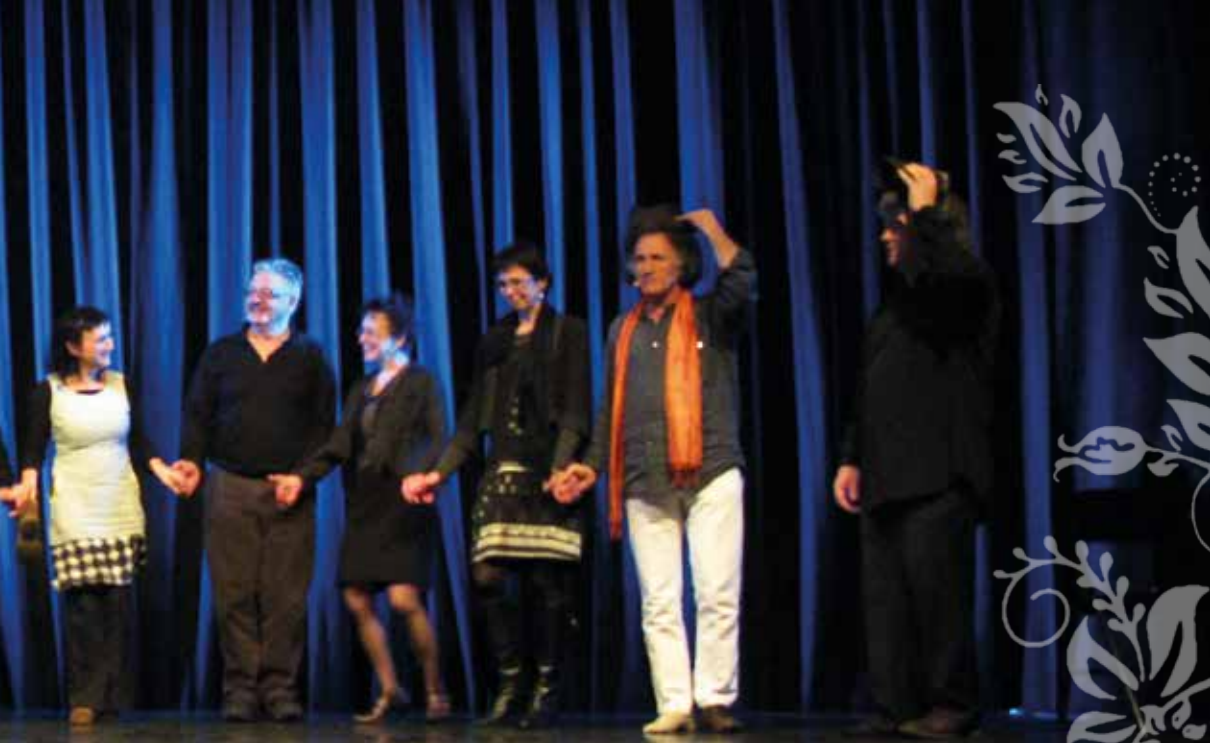
Soirée de clôture au Bruel en février 2020